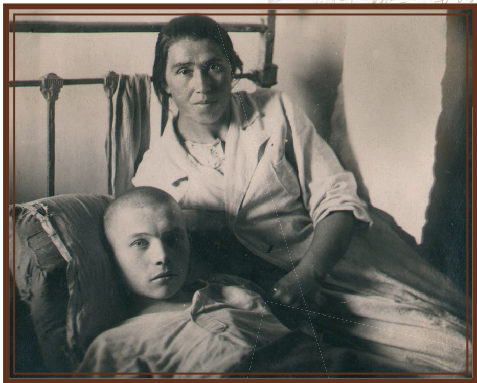
Госпиталь в г. Ессентуки.