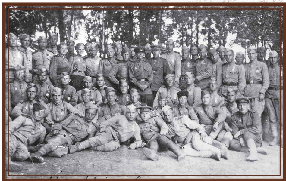
Разведрота (Рота разведки во время награждения).