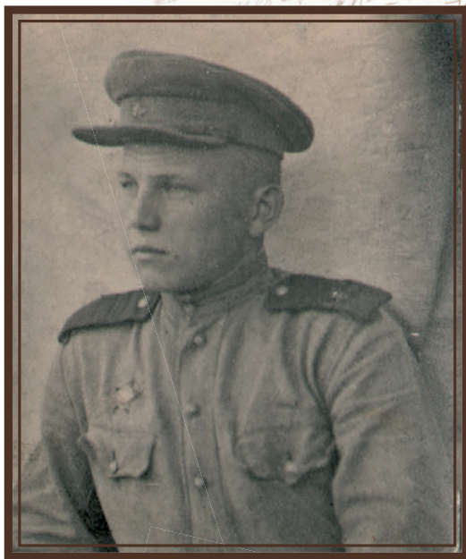
Фотография на фронте

Сформировали эшелон и отправили на фронт в конце апреля до станции Крестцы на поезде (ст. Крестцы – восточнее озера Ильмень Новгородской области). Эшелон в воздухе охраняли истребители, потому что немцы часто бомбили эшелон. До фронта – передовой Северо-Западного фронта, которая находилась на реке Ловать (южная часть озера Ильмень под городом Старая Русса), шли пешком до станции Парфино. Несмотря на победу под Москвой, положение на фронтах было крайне тяжелым.