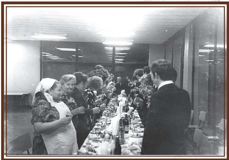
Проводы на пенсию. Октябрь 1978 года.